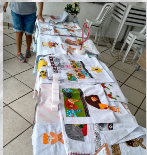
Oficina de Costura